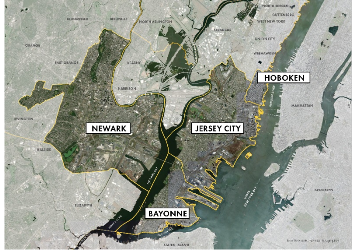
रेसिलिएंट उत्तर-पूर्वी न्यू जर्सी परियोजना क्षेत्र