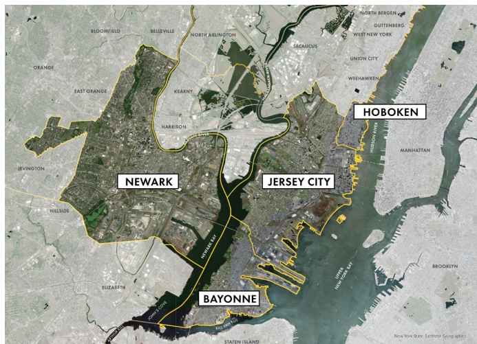
Obszar objęty projektem Resilient Northeastern NJ

Zobacz informacje na drugiej stronie ulotki na temat możliwości ZAANGAŻOWANIA SIĘ!