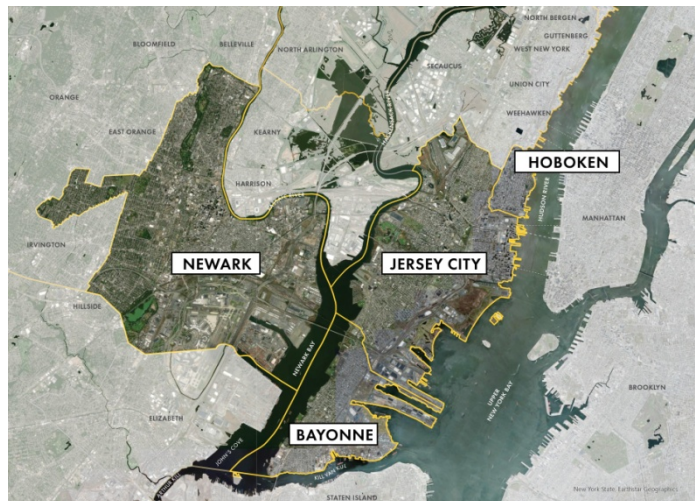
Área do Projeto Resilient Northeastern NJ

Consulte a segunda página deste panfleto e PARTICIPE!