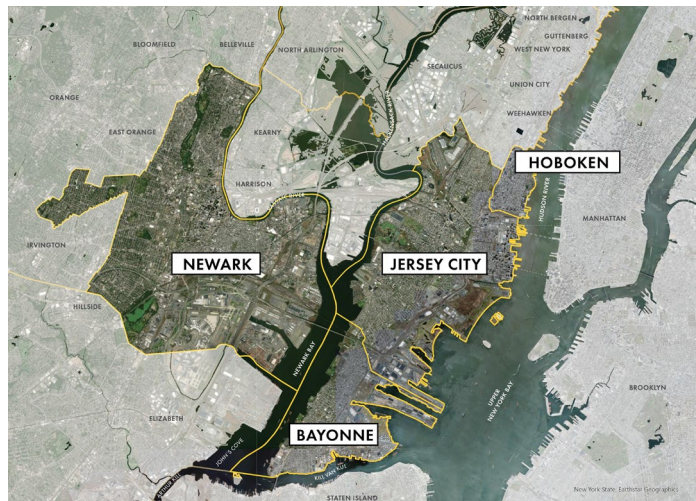
Zòn Pwojè Resilient Northeastern NJ